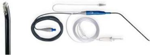
PROcise® LW Plasma Wand (EIC7070-01)