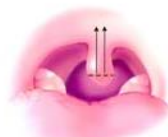
Uvular Rezeksiyon & Kanal açma