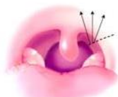
Palatta yukarıya doğru kanal açma