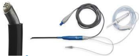
EVac® 70 Xtra HP Plasma Wand (EIC5874-01)