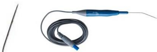
ReFlex Ultra® PTR Plasma Wand (EIC4835-01)