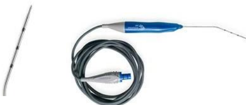
ReFlex Ultra® 45 Plasma Wand (EIC4845-01)