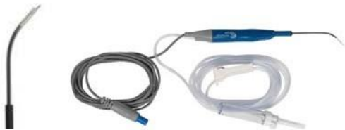
ReFlex Ultra® SP Plasma Wand (EIC4857-01)