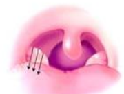
Tonsilde kanal açma