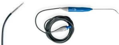
ReFlex Ultra® 55 Plasma Wand (EIC4855-01)